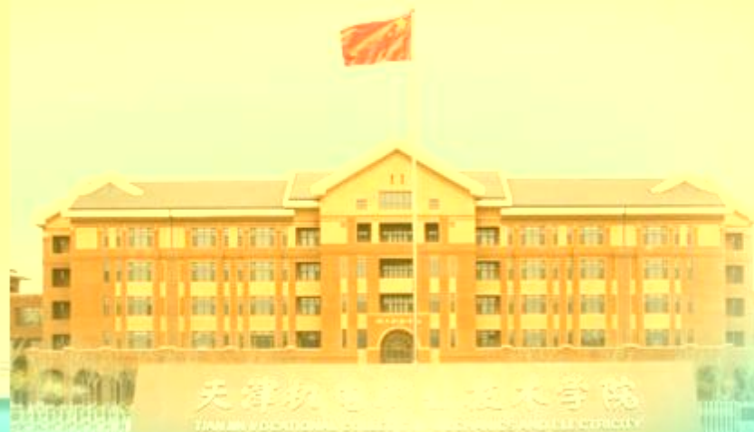
天津机电职业技术学院 TIANJIN VOCATIONAL COLLEGE OF MECHANICAL AND ELECTRICAL TECHNOLOGY